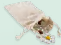
Vízceppel és vetőmagok