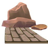
27 - Kövek