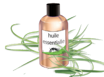
26 - Citromfű