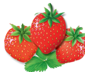
12 - Eper