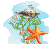
29 - Tenger