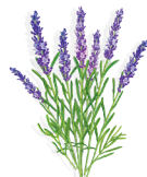
24 - Levendula