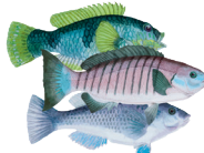
14 - Halak