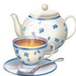
19 - Tea