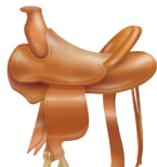
22 - Bőr