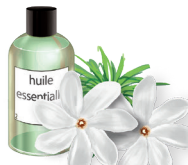
23 - Monoi