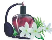
25 - Keleti parfüm