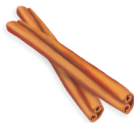
10 - Fahéj