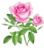
8 - Rózsa