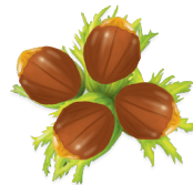
18 - Török-mogyoró