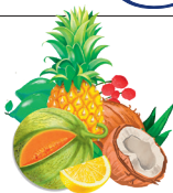
5 - Déli-gyümölcs