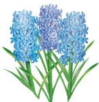
7 - Jácint