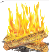
17 - Tábortűz