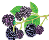
11 - Fekete-szeder