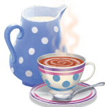
9 - Forró csokoládé