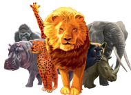
6 - Állatok